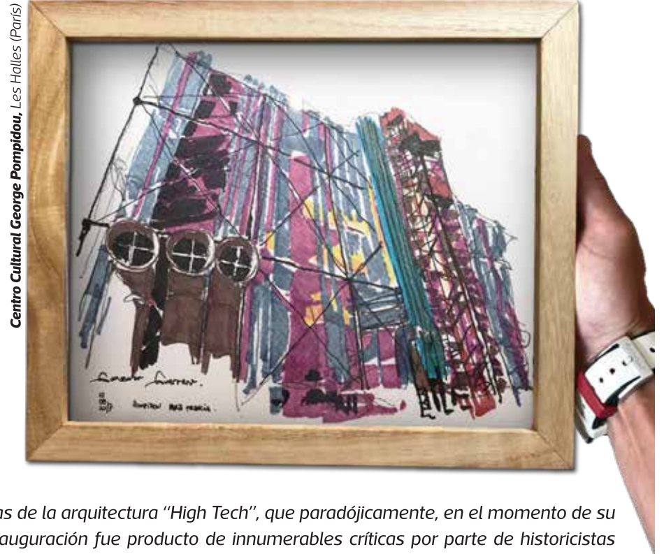
Centro Cultural George Pompidou, Les Halles (París)

A parte, la historia de este edificio me resulta muy interesante. Primero, porque nació de un concurso, a través de dos arquitectos principiantes, desconocidos - Richard Rogers y Renzo Piano. Segundo, por su ubicación, en un barrio medieval densamente poblado en la ciudad de París, una zona deprimida económica y socialmente, que se pretendía revitalizar con el concurso para centro cultural. Y por último, su concepto y simbolismo: el museo fue concebido como un gran container vacío, moldeable según las necesidades de cada evento, y rodeado por una envoltura tecnológica compuesta por los sistemas técnicos que sirven a ese gran espacio: la piel de vidrio con sus vigorosas estructuras metálicas de soporte, los conductos y equipos de acondicionamiento de aire y las escaleras mecánicas que conectan los diversos niveles del edificio. En la actualidad una de las construcciones más famo-